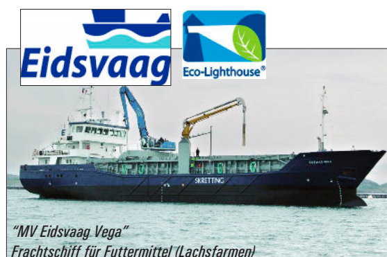
"MV Eidsvaag Vega" Frachtschiff für Futtermittel (Lachsfarmen)