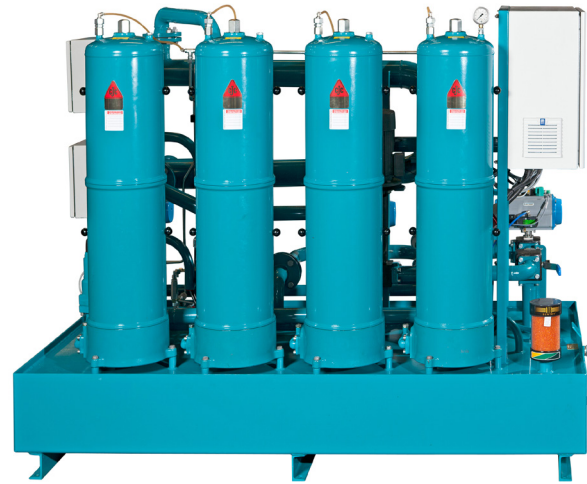
CJC™ Getriebespülanlage GFU 4x27/108

Optional kann die GFU 4x27/108 zur Fernüberwachung und -steuerung mit einem Router ausgestattet werden.