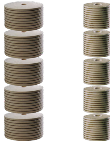
CJC™ Feinfilterpatrone 38/100 (modularer Aufbau)

CJC™ Feinfilterpatronen sind Tiefenfilter, d.h. die Abscheidung der Verunreinigungen erfolgt im Gegensatz zu Oberflächenfiltern in der Tiefe des Filtermaterials. Durch den langsamen Volumenstrom, wie er nur im Nebenstrom möglich ist, und die extrem langen Filterwege eines Tiefenfilters sind CJC™ Feinfilterpatronen besonders effizient. Denn je länger das Öl Kontakt mit dem Filtermaterial hat, desto wirksamer ist die Feinfiltration.