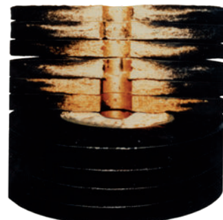
Querschnitt einer gebrauchten CJC™ Tiefenfilterpatrone