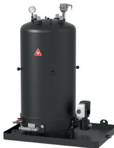
CJC™ Feinfilteranlage 427/108