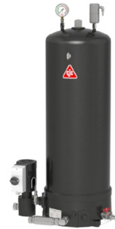
CJC™ Feinfilteranlage 38/100