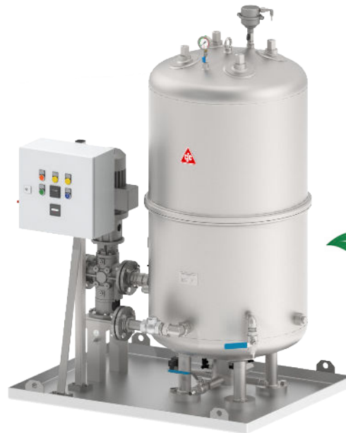
CJC® Filter Separator P6 427/108