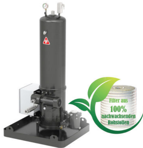
CJC™ Filter Separator P1 27/81