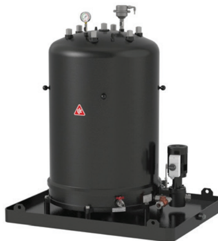
CJC™ Feinfilteranlage 727/108