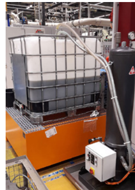
CJC® KSS-Filter zur Rückgewinnung des Schneidöls

Das gesammelte Öl aus den Brikettierpressen, das früher hätte entsorgt werden müssen, ist dank des CJC® KSS-Filters ideal als Schneidöl in den Mehrspindelmaschinen wiederverwendbar. Durch die vollständige Ölrückgewinnung vor Ort beim Betreiber entfallen Entsorgungskosten und Beschaffungskosten für neues Schneidöl sinken. Die Anschaffung des CJC® KSS-Filters hat sich innerhalb eines Betriebsjahres amortisiert und ist eine effiziente Maßnahme zur Optimierung der Prozesse für die an Gewichtung zunehmenden Umweltzertifikate.