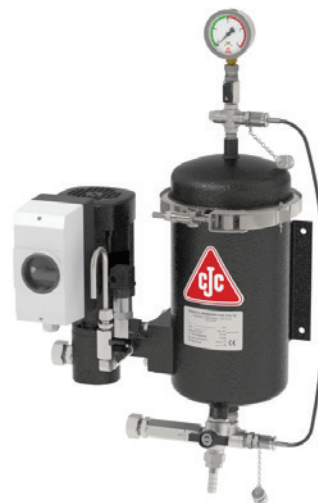
CJC™ Feinfilteranlage 15/25